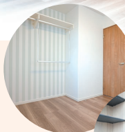
オープン クローゼット