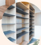
シューズクローク